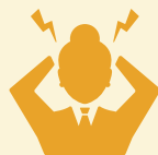
EKONOMIESE SKADE EN WERKSVERLIES