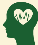
IMPAK OP VERSTANDELIKE EN FISIESE GESONDHEID